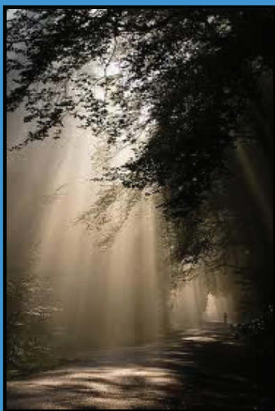
Lichtspel in Veluws bos

waarvan de beantwoording beslissend is voor de hoogte van de klassering bij gelijk eindigen.